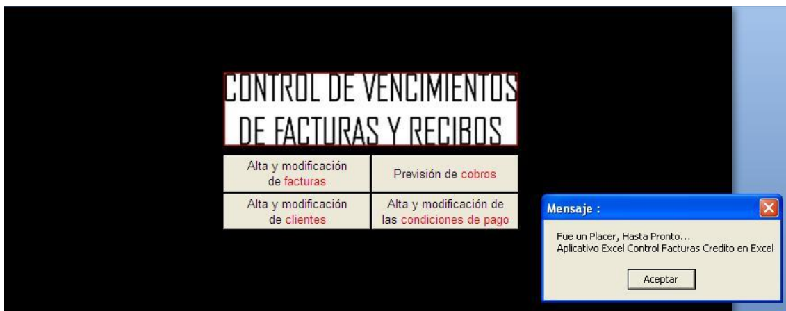
Gráfico # 10

Guarde y cierre el aplicativo normalmente. Se recomienda realizar copias de seguridad constantemente y en lo posible mantener información por periodos anuales.