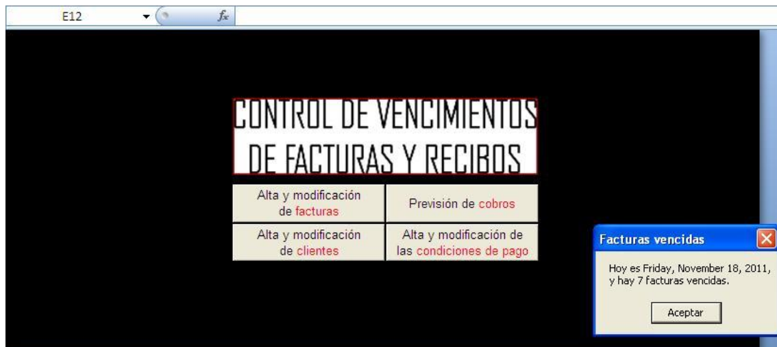
Gráfico # 02

El aplicativo mostrará la fecha y el número de facturas vencidas a la fecha.